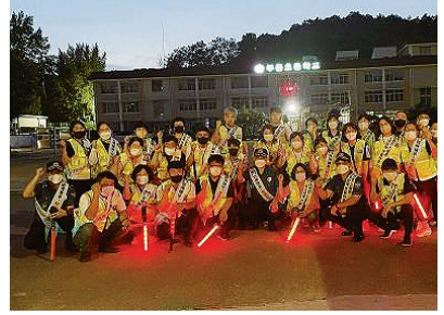
순찰하는 중앙자율방범대의 모습

교육지원청은 대상지 내 학교들과 함께 예산과 참여형 CPTED가 진행되는 데에 도움을 주었다. 부용초등학교는 야간에 운동장을 이용하는 주민 영동의 안전을 위해 보안등과 비상벨을 설치하고 위험한 공간을 개선하였고, 영동산업과학고등학교 또한 통합로 보행환경 개선을 위한 보·차도 구분 공사를 진행하였다. 두 학교 모두 학생과 교직원의 CPTED 교육을 진행하고, 참여형 CPTED의 진행을 지원하기도 하였다.