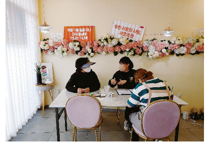
주민 설문조사 진행 모습

어렵다는 건축공간연구원의 의견에서 아이디어를 얻어, 지역의 기관·단체와 주민들이 함께 참여하는 CPTED로 부족한 예산 및 3급지 경찰서의 부족한 치안력까지 보완하기로 사업의 추진 방향을 설정하였다.