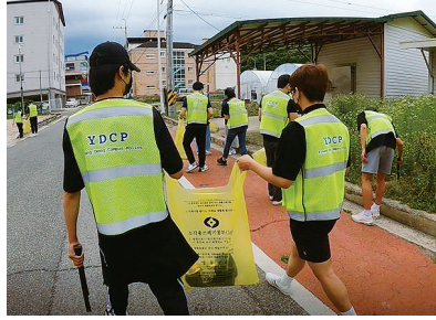
유원대학교 YDCP 활동 모습