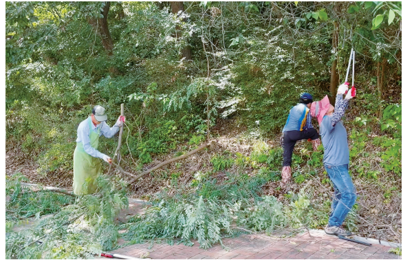
영동군 CPTED 사업 추진 모습

지자체(영동군)와의 협업은 사업 대상 구간인 통학로에 수년간 방치되었던 건설기계 장비를 비롯해 컨테이너 등 불법적치물과 야간 가로등 빛을 막던 우거진 수풀이나 나무를 정리하는 일부터 시작되었다. 이러한 협업은 이후 9개 기능, 11개 팀이 확립되는 것으로 이어져 주민 안전을 위한 긍정적 시너지를 만들어 나가고 있다. 영동군의회는 기관·단체 간 가교 역할을 톡톡히 담당하였으며, 경찰과 지자체 간 원활한 소통을 위한 업무협약의와 담당 업무 조율 등 추진력 확보에 큰 도움을 주었다. 또한 앞서 언급한 2차 추경 시 예산 확보에 있어서도 큰 역할을 해주었다.