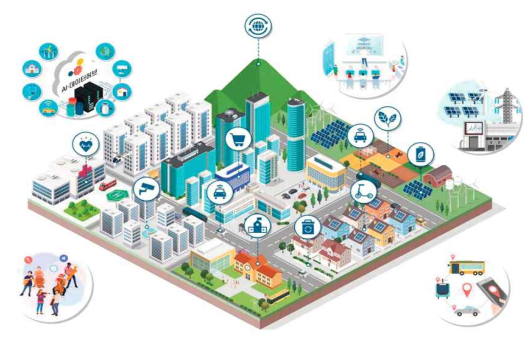
스마트시티 국가시범도시 서비스로드맵 1.0, 국토교통부 도시경제과, 2020.05.06. 출처: https://smartcity.go.kr/