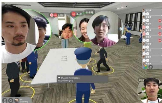
"민간기업도, 공공기관도 '메타버스 사옥'으로 출근한다"

6-1 (건축·도시분야 신기술·산업 육성) 스마트건축·도시기술, 신재생에너지 등의 건축·도시분야 신산업 발굴·육성 및 일자리 창출 방안 연구