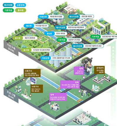
탄소중립 그린도시 모식도

5-2 (건축·도시공간의 탄소중립화 방안) 기후변화 및 환경문제에 능동적으로 대응하는 건축·도시공간 조성 및 활성화 연구