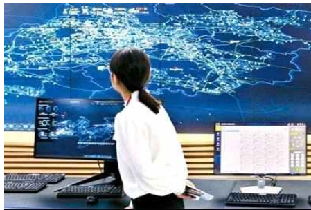
스마트시티대시보드