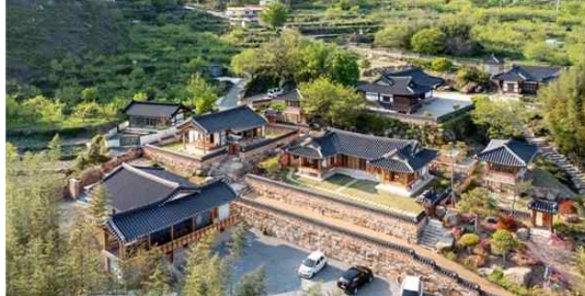
올해의 한옥대상에 경남 하동군 '하동 한옥문화관'

7-1 (역사문화자원 가치제고 및 활용) 지역 내 건축문화자산과 한옥의 가치를 발굴하고 활용하기 위한 방안 연구