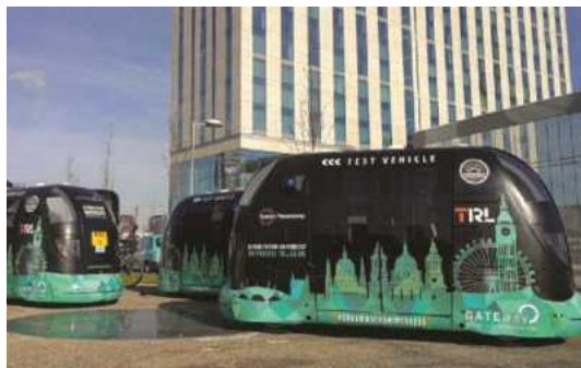
general public to take part in a driverless pod shuttle service trial around Greenwich 출처: https://trl.co.uk/projects/gateway-project/

6-2 (스마트건축·도시 활성화) 첨단 기술과 빅데이터를 활용한 스마트건축·도시를 구현하고 활성화할 수 있는 정책·제도 개선