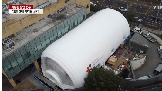
"중환자 병동 5일이면 설치"...이동형 음압병동 국내 개발 출처: https://www.ytn.co.kr/_ln/0105_202101071319444495

5-1 (재난·재해 회복탄력성) 코로나19 등 국가적 재해·재난으로부터의 국민 건강 및 안전을 확보할 수 있는 건축·도시공간 조성 연구