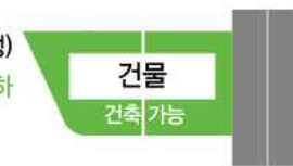
건축도시공간연구소 건축규제모니터링센터. (2017). 합리적인 건축심의의 운영을 위한 8대 과제. 건축공간연구원. p.13