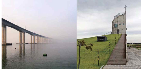
지자체 경관에 대한 종합검진, 경관자원조사-당진시 경관자원조사 사례 출처: 심경미, 김민경, 이경재, 송윤정, 방재성, 안재락, 주신하, 이석현, 윤동진. (2021). 국토경관 GOOD PRACTICE 2. 건축공간연구원.

7-2 (국토경관 향상) 지역특색을 살린 경관향상 및 정책지원 방안 연구