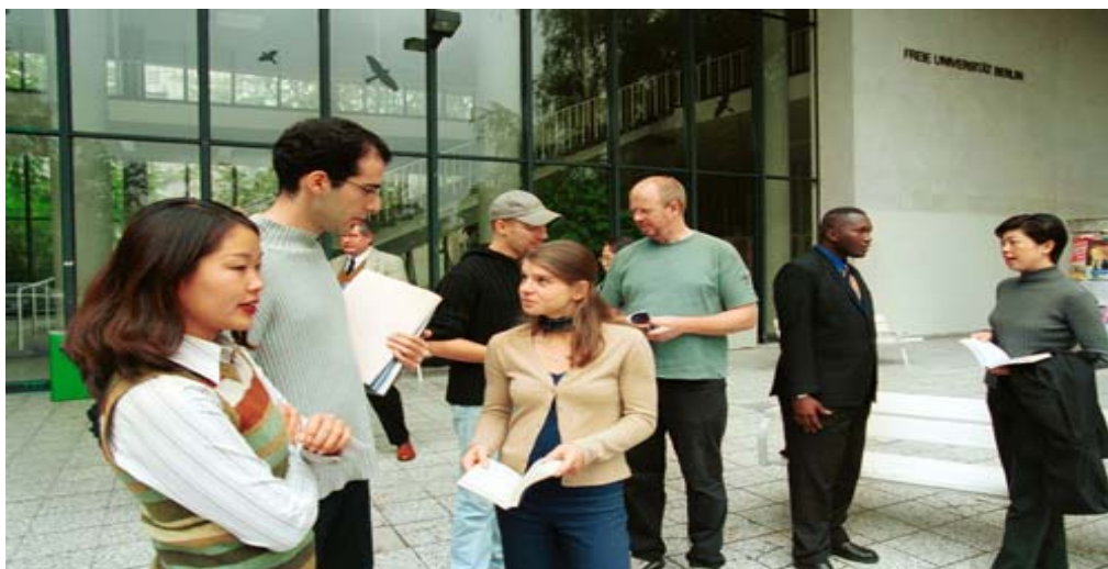
그림 11 International and Open

베를린 자유대는 연구와 교수에 중요한 영향을 미치는 수많은 대학과 기구들과 국제적 네트워크를 형성하고 있다. 오늘날 베를린 자유대는 매년 다양한 분야의 연구와 교수에 기여하는 약 600명의 방문연구원과 121개의 파트너십을 보유하고 있다