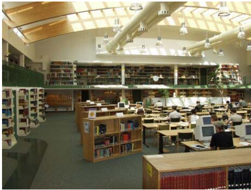
그림 5 University Library

소로 존에프케네디 북미연구소(John F. Kenedy Institute for North American Studies), 라틴아메리카연구소(Institute for Latin American Studies), 동유럽연구소(Institute for Eastern European Studies) 등이 있다.