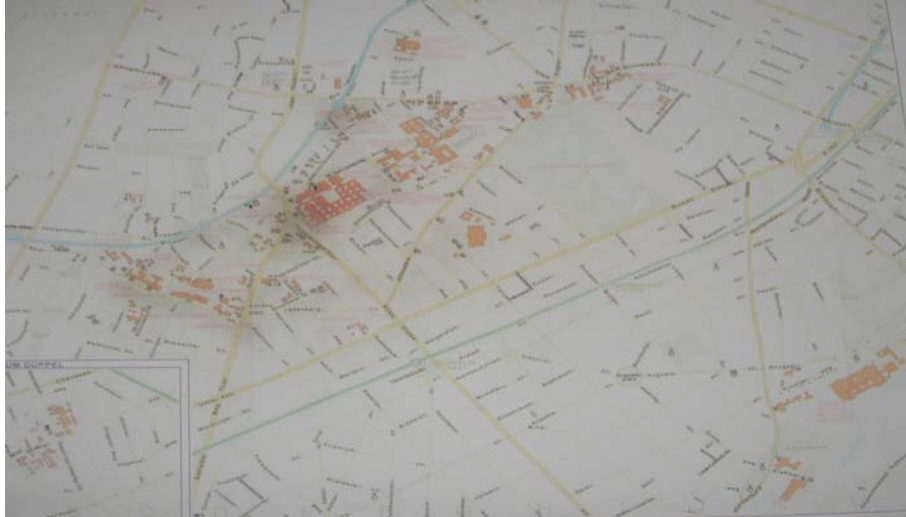
그림 2 베를린 자유대 캠퍼스 분포

학생은 기숙사 신청 후 1학기에서 4학기 정도 기다려야 얻을 수 있다. 캠퍼스는 도시의 전 지역에 산재해 있으나 대부분의 건물이 베를린 남부인 달렘(Dahlem) 지역에 자리잡고 있다.