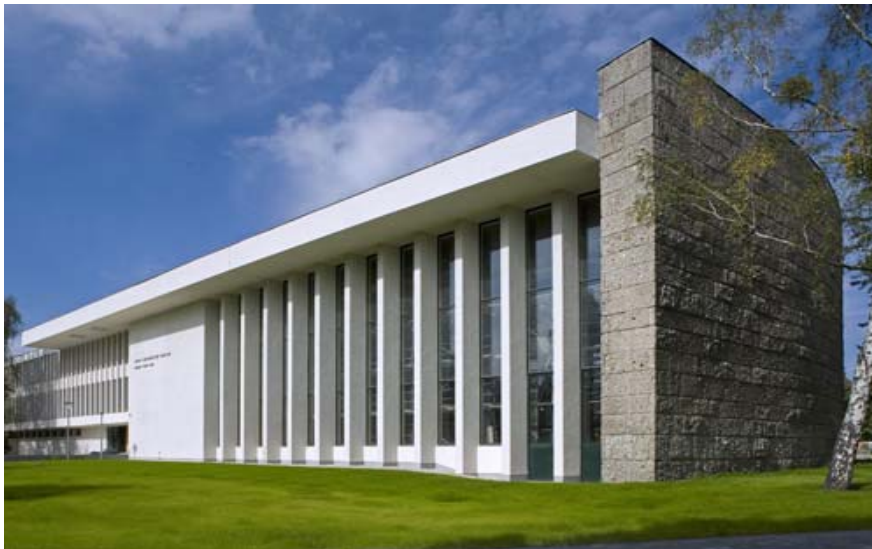
그림 4 Henry Ford Building