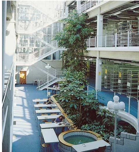
그림 9 Department of Education Library