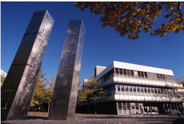
그림 7 Institute for Chemistry and Biochemistry

공기업과 사기업으로 지식과 기술의 이전을 적극적으로 추진하는 것에 더불어, 베를린 자유대는 개별 산업에 의한 혁신적인 연구 결과의 활용을 독려하고 있다. 또한 대학생, 졸업생 및 연구자에 의한 벤처사업의 기반을 지원하고 있다. 베를린 자유대의 연구성과의 우수성은 대학 순위에서 상위에 위치하고 있는데, 이는 DFG(독일연구공동체)투자 순위, 고등 교육 세계 대학 순위 및 CHE 연구 순위를 포함한다. 대학 연구 성과의 우수성은 과거 수년 외부 기금의 지속적 증가와 베를린 자유대의 학자들은 저명한 학자에게 주는 라이프니츠(Leibniz)상을 수상하였다.