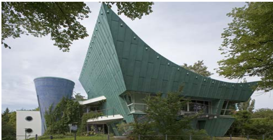
그림 10 Continuing Education Center