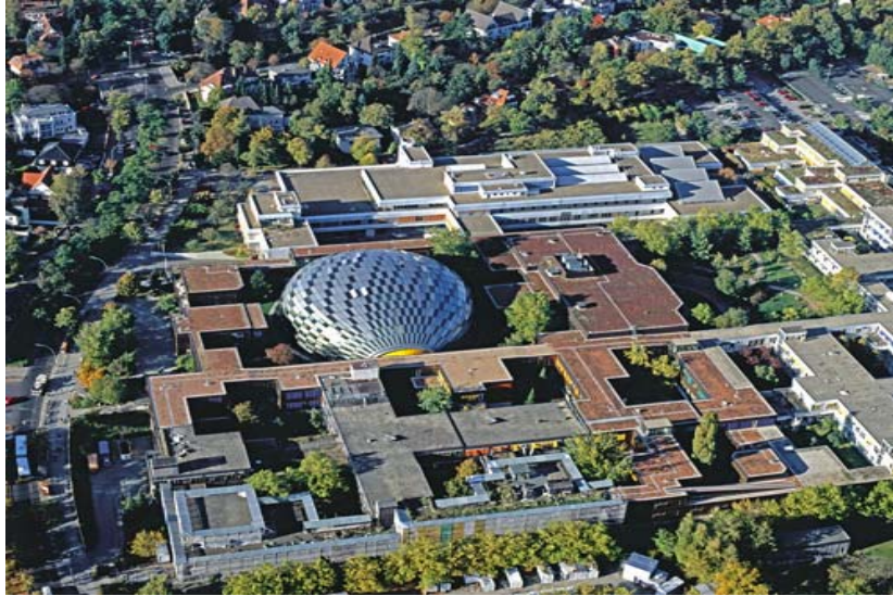
그림 3 Freie Universitaet 전경