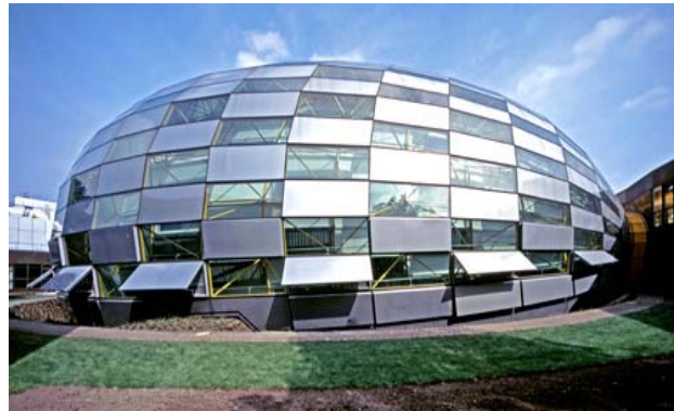
그림 6 Exterior View of the Philological Library

중앙도서관에는 200만 권 정도의 도서가 소장되어 있으며 약 4,000종 이상의 정기간행물을 보유하고 있다. 이중 40만권의 책은 사전 예약 없이 언제든지 대출이 가능한 개가식 도서이다. 이밖에 각과 도서관에 약 600만 권의 도서와 2만여 종의 정기간행이 더 있다. 연구대학으로서의 자유대의 면모는 도서관 시설에서도 잘 드러난다. 중앙도서관과 71개의 단과대학 및 연구소 도서관으로 구성된 자유대의 도서관시설은 독일 전체 대학 중 최대 규모를 자랑한다.