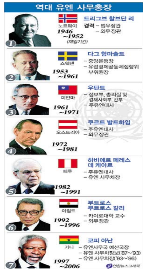
역대 유엔 사무총장 현황과 주요 활동

2006년 12월 말 물러난 코피 아난 총장은 르완다 사태 해결 등 업적을 남겼다. 그러나 수단 다르푸르 학살 문제를 해결하지 못하고 유엔 개혁도 미국 등 강대국의 벽에 부딪쳐 호지부지될 상황에 처해 있다. 임기 중 미국의 이라크 침공에 반대해 미국과 불편한 관계였으며, 2001년 노벨 평화상 수상함.