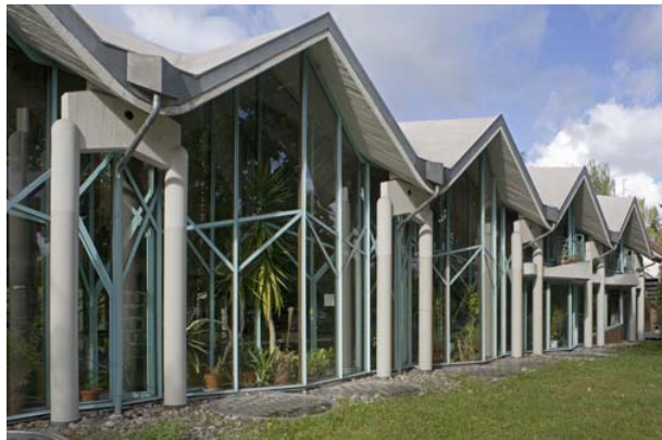
그림 8 Institute for Philosophy