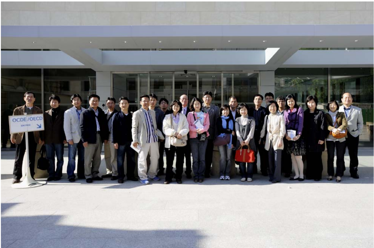
(OECD 연수를 마치고 건물 앞에서)