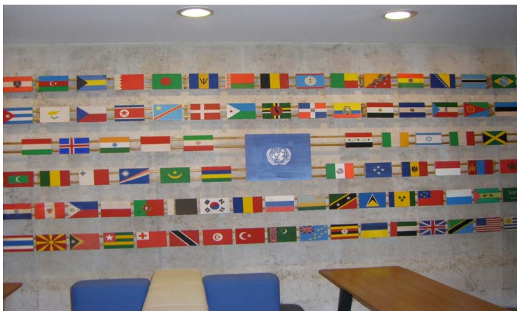
(FAO 현관에 진열된 회원국들의 국기)