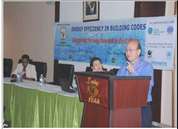
사진2. Feng Liu, World Bank 주제발표(4.24/1일차)