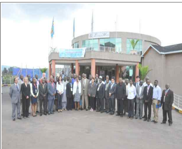
사진11. 워크숍종료 후 단체기념사진(4.26/3일차)