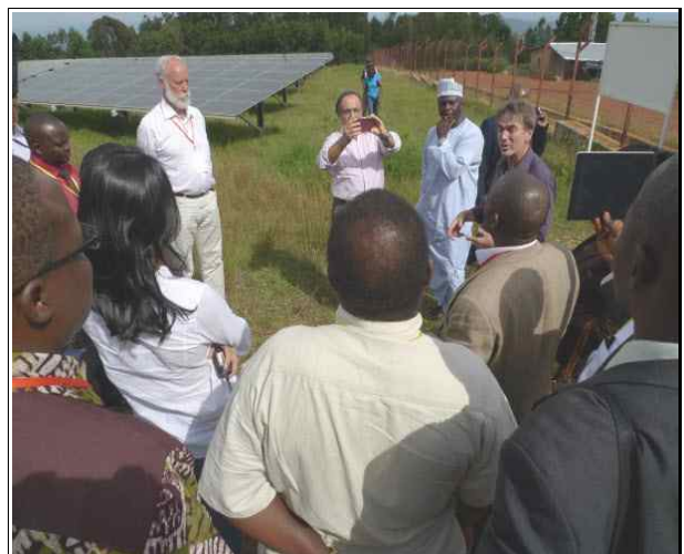
사진12. 태양광발전소 현장방문(4.26/3일차)