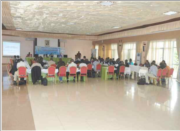
사진1. EEBC 워크숍 전경(4.24/1일차)