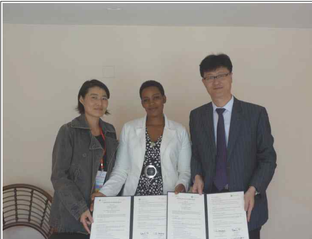
사진9. MOU체결 서명 후 기념사진(4.25/2일차)