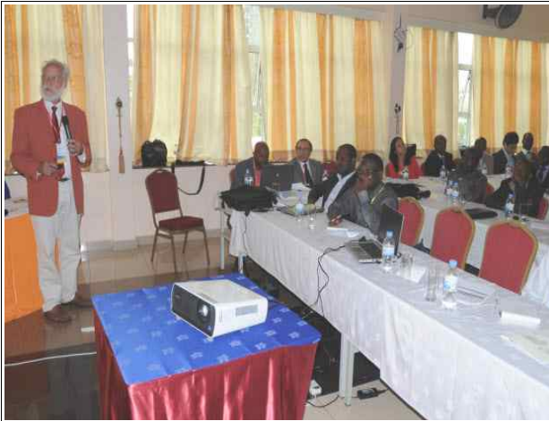
사진7. Claude-Alain Roulet, UN-Habitat 발표(4.25/2일차)