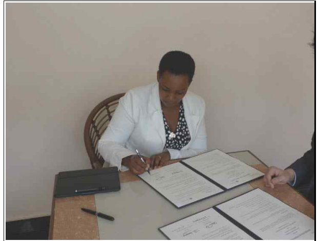
사진8. MOU서명하는 에스더 무탐바 르완다주택청장(4.25/2일차)