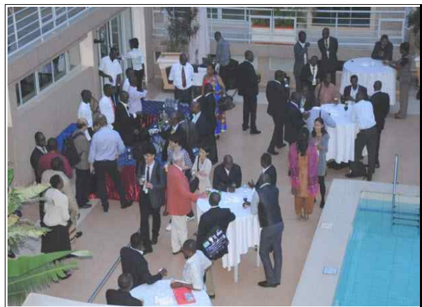
사진4. 환영리셉션 전경(4.24/1일차)