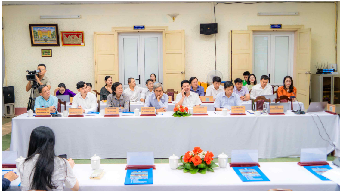
〈세미나 행사장 전경〉