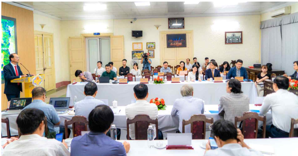
세미나 행사장 전경