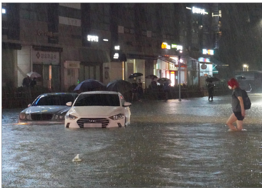
강남역 인근지역 홍수 피해 실태

우리나라에서는 홍수와 같은 자연재해의 발생 빈도와 강도가 증가하고 있다. 2020년 장마는 역대 가장 긴 기간 지속되었으며, 경제적인 피해는 최대 1조 원으로 집계되었다는 보도가 있었다 (임아영, 2020). 2022년 8월 서울시 일대의 집중호우로 발생한 홍수는 강남역 인근 지역에 약 700억 원에 이르는 피해를 입혔고, 홍수에 미처 대피하지 못한 관악구 반지하 거주 일가족의 사망을 야기하였다.