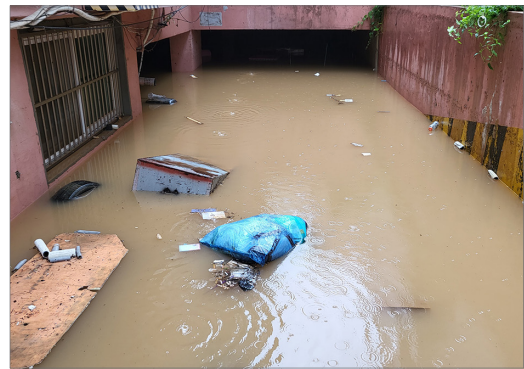
건축물 반지하 침수 피해 현장