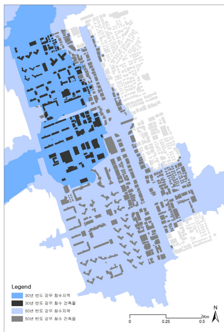
침수피해 예상 건축물 사용승인일 분포

먼저 사용승인일을 살펴보면, 오래된 건축물일수록 노후화되어 상대적으로 침수에 취약할 것으로 예상하였다. 분석결과 1970년에서 1989년 사이에 사용승인된 건축물이 30년 빈도 및 50년 빈도 강우 시 전체 침수예상 건축물의 약 25%를 차지하고 있다. 즉, 홍수 발생 시 상대적으로 오래된 건축물이 침수될 가능성이 높아 이에 대한 대비가 필요하다.