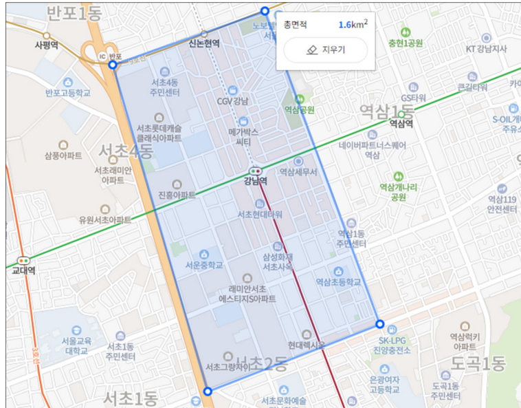
서울 강남역 일대의 홍수피해 발생지역