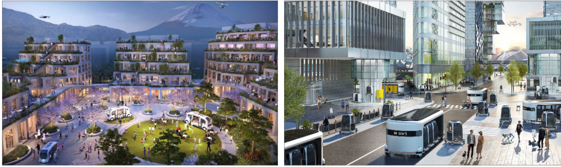
토요타와 현대자동차가 제시한 미래 모빌리티와 연결된 건축공간