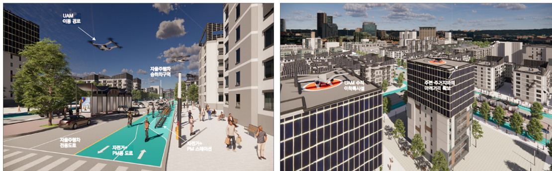
스마트 기술·서비스의 접목을 고려한 도시 공간 변화