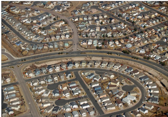
자동차가 만든 도시 교외 주거지역

건축공간도 변하였다. 도시 외곽으로 형성된 단독주택에는 도로와 차고 등 자동차를 위한 공간들이 필수적으로 있어야 했고, 도심에서도 주차장이 건축물의 지하·지상으로 만들어지는 등 건축과 자동차를 위한 공간이 공존하기 시작하였다.