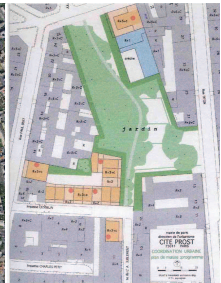
시떼 프로스트 마스터플랜