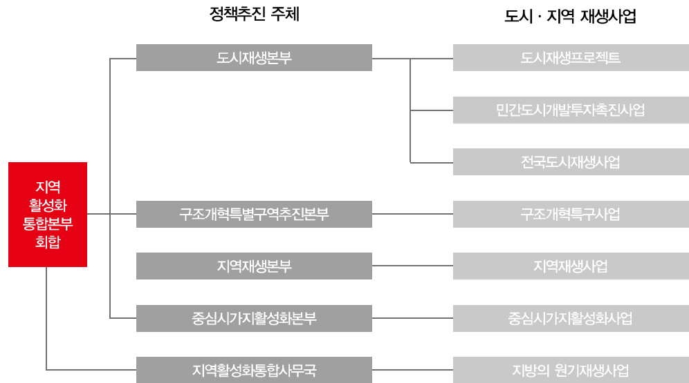
일본 도시·지역재생정책 추진체계

통합사무국'을 설치하여 본부별로 추진되는 재생정책들의 창구를 일원화하는 한편 4개 본부의 통합회의인 '지역활성화통합본부회합'을 개최함