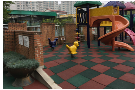
놀이공간에 안전한 바닥재료 사용