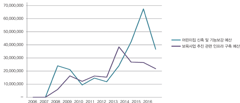
국공립어린이집 관련 정부예산 추이(2006년~2016년)

※ 출처 : 대한민국정부, 「2016년도 세입세출예산안 사업별 설명서(Ⅳ)」, p.169; 「2015년도 세입세출예산안 사업별 설명서(Ⅳ)」, pp.173~174; 「2014년도 세입세출예산안 사업별 설명서(Ⅳ)」, pp.171~172; 「2013년도 세입세출예산안 사업별 설명서(Ⅳ)」, p.221; 「2012년도 세입세출예산안 사업별 설명서(Ⅳ)」, pp.215~216; 「2011년도 세입세출예산안 사업별 설명서(Ⅳ)」, pp.224~225; 「2010년도 세입세출예산안 사업별 설명서(Ⅳ)」, pp.233~234; 「2009년도 세입세출예산안 사업별 설명서(Ⅳ)」, pp.243~244; 「2008년도 세입세출예산안 사업별 설명서(Ⅳ)」, pp.151~208; 「2007년도 세입세출예산안-보건복지부」, pp.1~63의 데이터를 토대로 작성