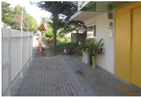
도로변 울타리 설치