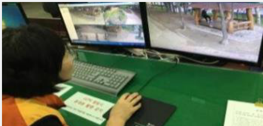
양산시, 마약류 위반 용의자 포착 자료화면

주요 내용: 양산경찰서에서 마약류 위반 용의자인 카자흐스탄 국적의 불법체류자 남성의 인상착의를 전달 받은 뒤 담당 관제요원의 집중 모니터링을 통해 현행범 검거 성공