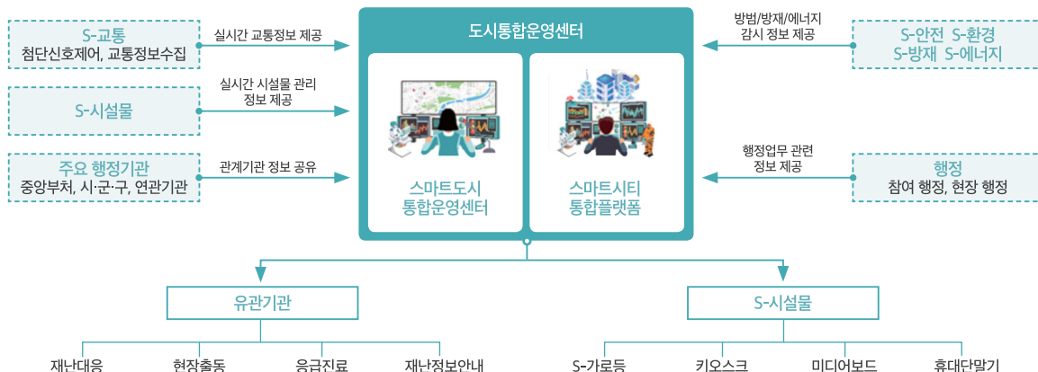
스마트도시 통합운영센터의 운영 개념