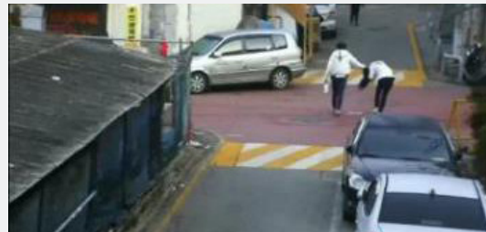
수원시, 데이트폭력 현장 자료화면

주요 내용: 20대 남성이 여성의 머리채를 움켜쥐고 끌고 가는 것을 수원 도시안전통합센터 CCTV 통합관제상황실에서 파악, 112상황실에 신고하여 8분 만에 경찰 출동 및 검거