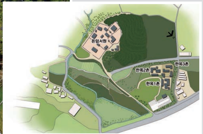
돈암서원 배치도 ▲