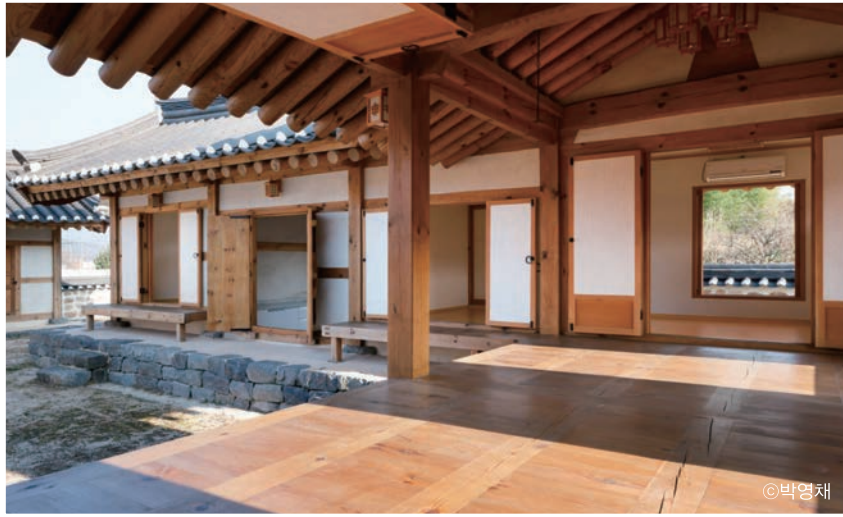
한옥2촌 안채의 대청 ▲

가구(架構)의 구성은 별도의 수장이 없는 민도리 양식이고, 처마는 훌처마로 소박하게 하였다. 한식기와 끝에는 와구토를 올려 검은 지붕에 하얀 점이 줄지어 보이도록 가볍게 처리하였다. 벽면에 설치한 창호는 실의 성격에 맞추어 살창, 판문, 들어열개문 등으로 구성하고 내부 벽지와 천장도 전통한옥에서 볼 수 있는 색채와 재료로 마감하였다.