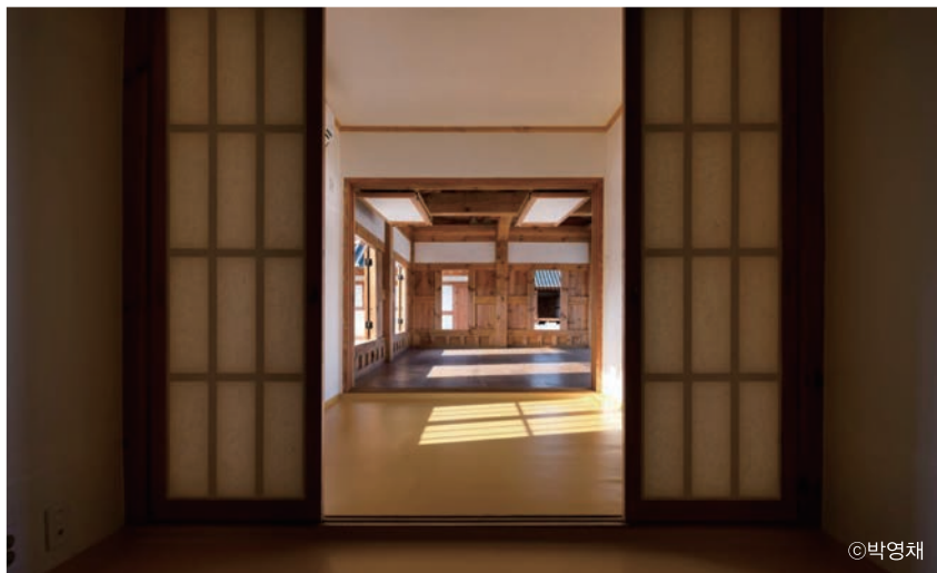
한옥2촌 안채의 방 ▼

한옥1촌과 한옥2촌은 단체 체험객들을 위한 공간으로 크고 작은 대청과 마당에서 다양한 모임 및 체험활동이 가능하다. 문간채와 별채에는 공동으로 사용할 수 있는 화장실과 샤워장이 설치되어 있다.