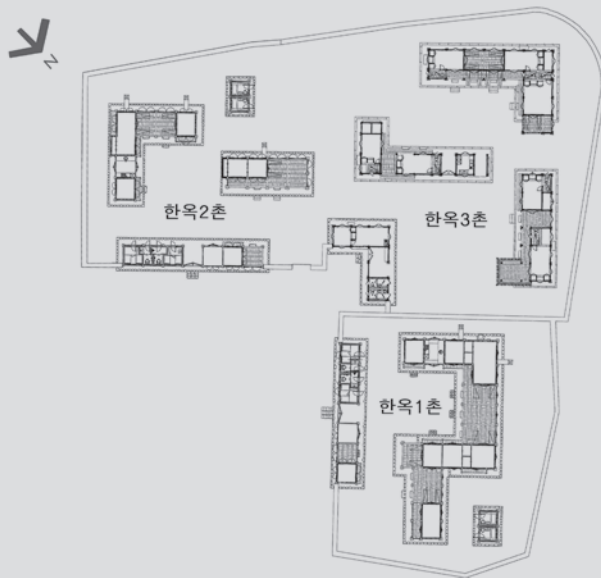
한옥마을 전체 배치도 ▲