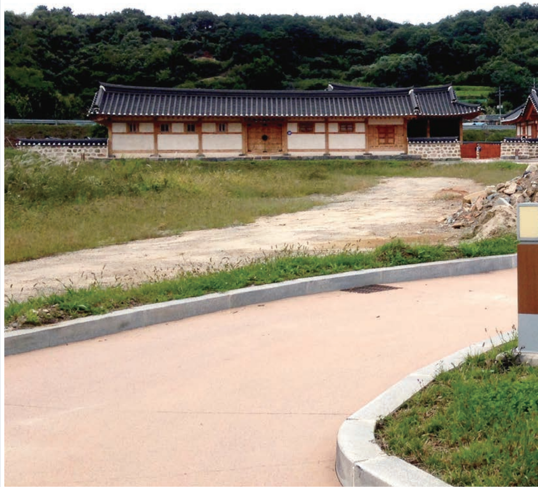
한옥마을 입구 ▲

돈암서원은 1634년 조선 중기의 대표적인 유학자 사계 김장생(沙溪 金長生, 1548~1631)의 학문과 덕행을 추모하기 위해 세워진 기호지방(충청, 경기)을 대표하는 서원이다. 돈암서원은 대원군의 서원 철폐령에도 훼손되지 않고 보존된 47개 서원 중 하나로 서원 전체가 사적으로 지정되어 있으며 이 중 강당인 응도당(凝道堂)은 보물로 지정되어 있다.