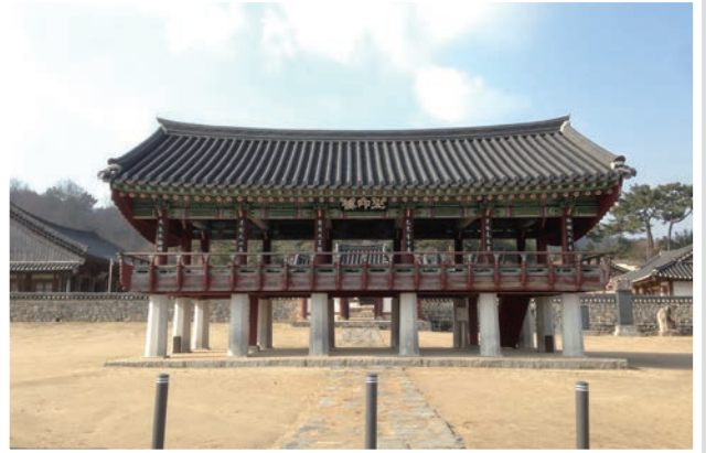
논산 돈암서원(사적 제383호) ▲