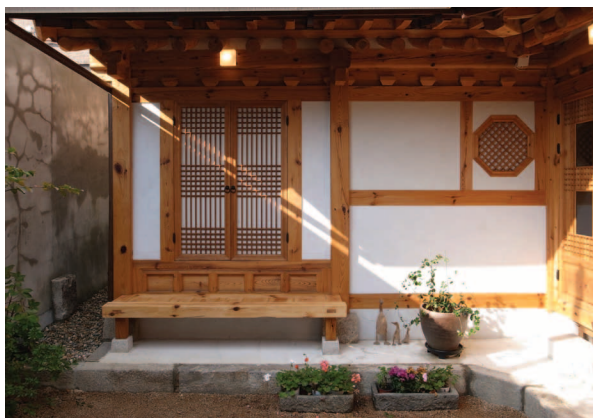
그림3. 서울 가회동에 있는 주택 (현대한옥)

문제는 건축양식에 대한 판단이 개입되는 OO한옥의 경우이다. 건축의 본질이 정면에 있다고 믿었던 시기도 있었고, 또 그것이 공간에 있다는 주장이 크게 영향을 끼친 시기도 있었다. 그러나 이러한 주장은 여러 측면의 요소가 함께 모여 이루는 건축의 본질 가운데 시대적 요청에 따라 어느 한 면을 부각하기 위한 언설이지, 그것만이 절대적이라는 의미는 아니다. 건축적 추구의 가장 마지막에 자리하는 아름다움조차 눈으로 보고 만져서 느끼는 감각적 판단에서부터, 주변 환경과의 심리적 조화에서 오는 정서적 판단, 시대적 부름에 답하는 윤리적 일체감에 근거한 이성적 판단까지 다양한 차원을 갖는다.