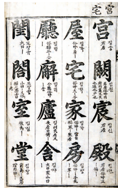
그림1. 1527년(중종 22) 최세진(崔世珍)이 지은 한자 학습서인 『훈몽자회(訓蒙字會)』에는 家와 宅은 물론, 宮, 殿, 房, 廬, 院 등 모두 23개의 한자어가 집을 훈(訓)으로 달고 있다.

그렇다면 한옥의 규정은 어디까지를 한민족의 고유한 특성으로 볼 것이냐의 문제로 돌아온다. 한옥의 형태는 지역과 시대에 따른 차이가 엄연하고, 그 원형을 쫓는 일도 간단치 않다. 세대를 걸쳐 계속 사용되면서 내려왔기 때문에 크고 작은 변화가 끊이지 않았을 뿐만 아니라 오랜 역사 속에서 어디부터를 한민족의 특성이 발현되는 시기로 볼 것인가 하는 문제도 풀기 어렵다.