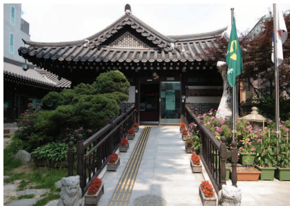
그림4. 혜화동 주민센터 (한옥 동사무소)