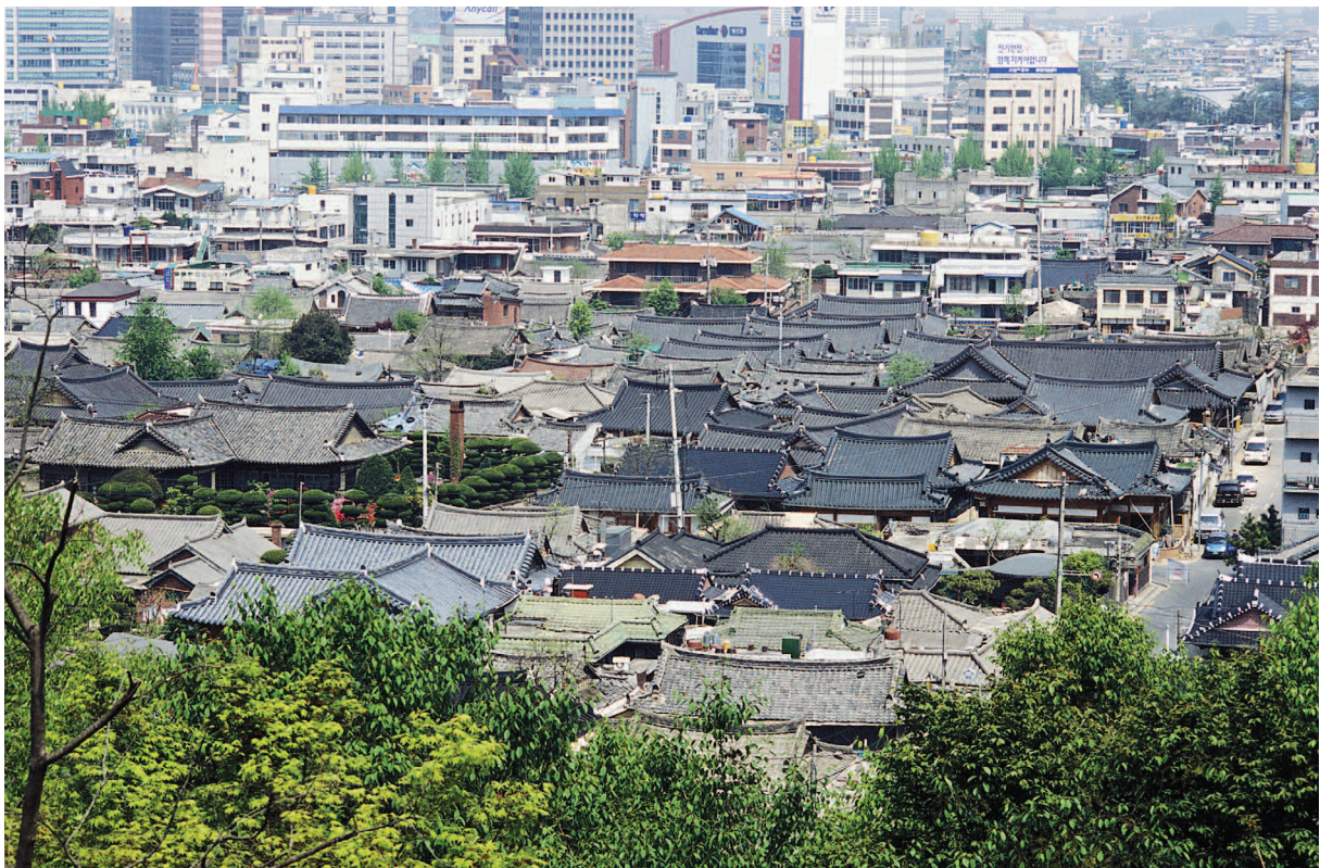
그림1. 오목대에서 본 전주 한옥마을

한옥마을과 관련되는 용어로 전통마을, 민속마을, 역사마을이 있다. 전통마을은 말 그대로 전근대시기에 조성된, 전통이 있는 마을을 일컫는다. 그리고 그 중에서 중요 민속문화재로 지정된 마을을 보통 민속마을이라 한다. 한편 역사가 오래된 마을을 의미하는 역사마을은 유네스코에서 하회마을과 양동마을을 세계유산으로 지정할 때 사용되었다. 어떤 용어를 사용하든 마을은 공동체를 이룬 거주자들의 생활영역을 지칭한다.