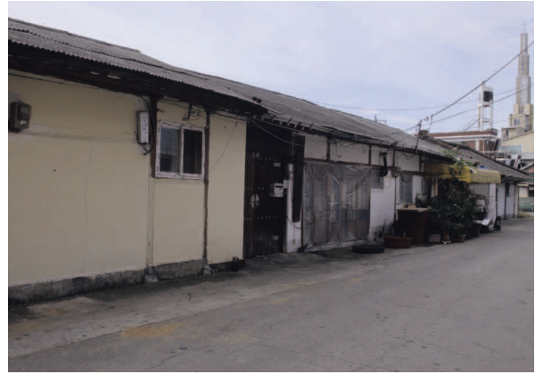
그림3. 문간채가 나란히 선 안성 도심의 가로

대부분의 한옥마을은 농촌지역에 있다. 전원의 한옥마을에는 전근대시기에 지어진 한옥들이 여전히 주거로 사용되고 있다. 한편 최근 전라남도를 비롯해서 지자체의 지원으로 새로 조성한 한옥마을도 늘어나고 있다.