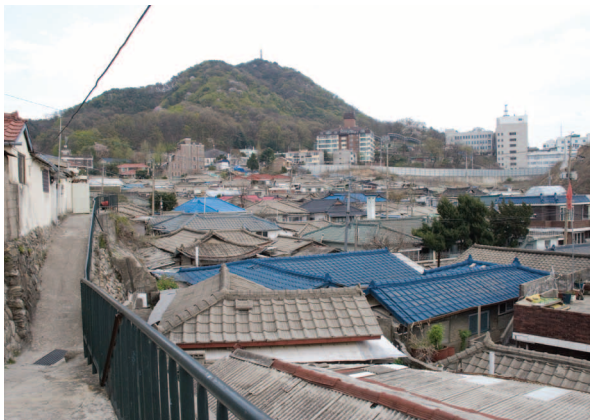
그림6. 춘천 소양동 기와골

오늘날 도시지역의 한옥마을에서는 한옥들이 대개 50년이 넘어 노후화되었고 따라서 지구가 재개발의 압력을 받고 있다. 춘천 소양동의 ‘기와골’은 이미 수년 전에 재개발지구로 지정되어 언제 재개발될지 모르는 상태이다. 안동 옥정동에서는 한옥이 한 채씩 철거되어 점점 한옥마을의 특색을 잃고 평범한 도시 주거지로 변모하고 있다.