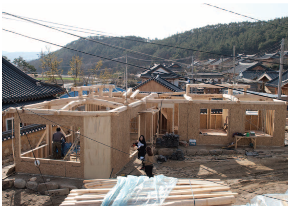
그림4. 오미마을의 현대한옥단지(전남 구례군 토지면)

현재 지자체에서 추진 중인 신규 한옥마을 조성 사업을 정리하면 다음의 표 2와 같다. 이밖에도 농림수산식품부의 농촌마을 종합개발사업 및 전원마을조성사업으로 계획된 한옥마을 사업 각각 14, 22개가 있는데, 이 사업들은 주로 전라남도에 집중적으로 계획되어 있다.