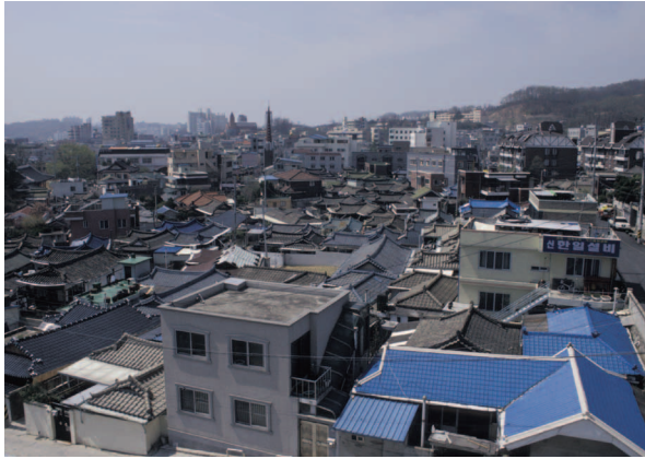
그림2. 안동 도심의 한옥마을