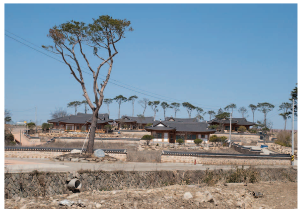
그림5. 구림마을의 현대한옥단지(전남 영암군 군서면)