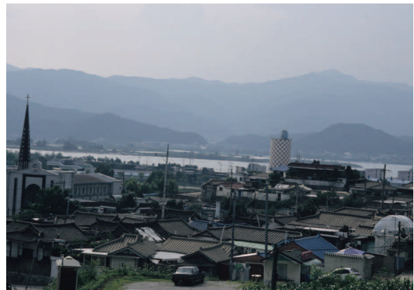
그림7. 춘천 소양동 기와골