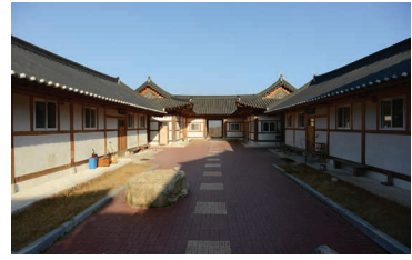
지자체의 지원을 받아 신축한 학교