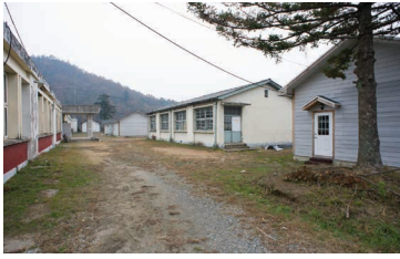
폐교를 활용한 학교