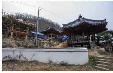
개인 소유 부지를 활용한 학교