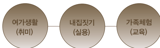
그림1. 한옥짓기 체험과정의 수요