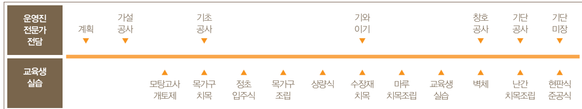
그림 2. 한옥짓기 체험강좌의 진행순서