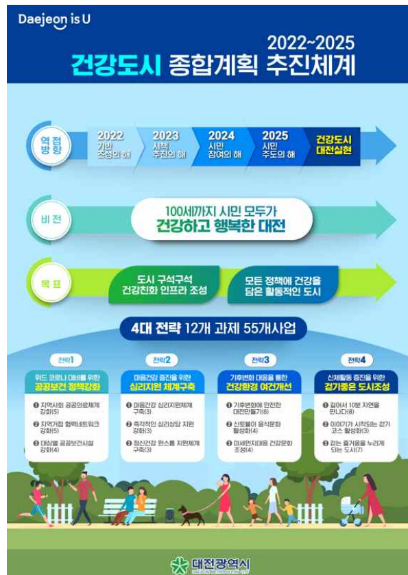
[ 대전광역시 건강도시 조성 종합계획(2022~2025) 개요 ]

이를 위해 ①위드 코로나 대비를 위한 공공보건 정책강화, ②마음 건강 증진을 위한 심리지원 체계구축, ③기후변화 대응을 통한 건강환경 여건개선, ④신체활동 증진을 위한 걷기 좋은 도시조성 등을 4대 전략으로 설정하고, 12개 과제 55개 세부사업을 계획했다.