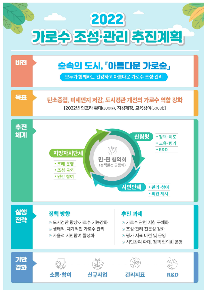
[ 2022 가로수 조성·관리 추진계획 ]

산림청에서는 '2022년 가로수 조성·관리 계획' 수립을 통해 '숲속의 도시, 「아름다운 가로숲」'을 비전으로 △가로수 관련 지침 구체화, △조성·관리 전문성 강화, △평가지표 마련 및 운영, △시민참여 확대, 정책 협의회 운영 등 4가지 전략과제를 추진한다.