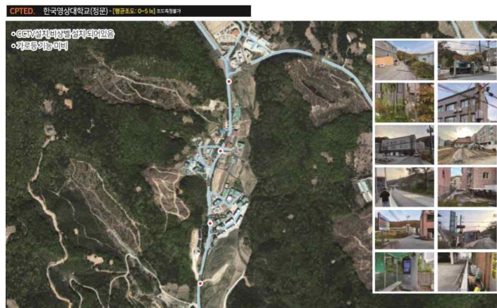
[ 한국영상대 원룸가 셉테드(CPTED) 기본계획 ]

기본설계 단계부터 공사까지 지역 주민, 대학교 관계자, 대학생, 전문가, 관계 기관 등의 의견을 수렴해 사업의 완성도를 높이고 범죄발생 우려를 사전에 제거할 예정이다.