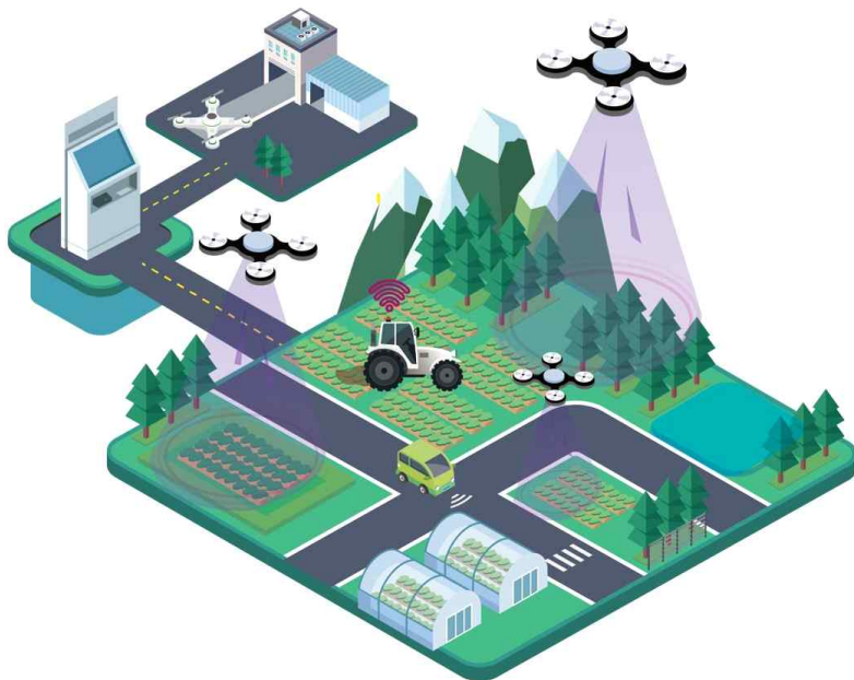
[ 충청북도·증평군 스마트빌리지 서비스 실증 공모사업 서비스 구현도 ]

스마트팜 통합 플랫폼 구축사업의 주요 내용은 드론 자동충전·자동약제 주입 기능의 드론스테이션 개발, 드론 및 농작업상황·작물식생지수·대기질 측정 등 농업정보 빅데이터 구축, 드론 RTK-GPS 정보 실시간 공유, 트랙터·드론간 통합운영관리시스템 구축 등 실증을 통해 통합 모델을 개발할 계획이다.