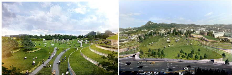
[이건희 기증관을 품은 송현문화공원 조감도 기획(안)]

임시개방 이후 2025년부터는 송현동 부지를 ‘(가칭)이건희 기증관’을 품은 ‘(가칭)송현문화공원’으로 조성하는 작업을 시작한다. 송현동 부지를 대한민국 문화 브랜드가치를 높이는 대표 문화관광명소로 육성한다는 목표다. 이를 위해 현재 기본계획(안)을 마련한 상태로, 자연과 문화가 어우러진 하나의 공원으로 구현될 수 있도록 통합설계 지침을 정하고 내년 상반기 국제현상공모를 통해 통합 공간계획안을 마련할 계획이다. 2025년 1월 착공해서 2027년 ‘(가칭)이건희 기증관’과 공원을 동시에 완공해 개장하는 것을 목표로 한다.