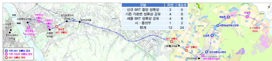
[세종~공주 광역 BRT 운행 노선도(안)]

이와 함께, 출퇴근 시간에는 배차간격을 8분 이내로 계획하고, 첨단기능과 편리성을 갖춘 정류장을 설치하여, 이용객의 편리성을 높이고 품격높은 교통 기반이 마련되어 광역교통 서비스의 수준을 한 단계 더 끌어올릴 것으로 기대된다.