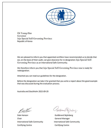
[제주국제안전도시 공인 승인 통보 문서]

소방안전본부는 공인 승인 확정에 따라 오는 11월 11일 제주시민복지타운에서 국제안전도시 4차 공인을 선포하는 기념식을 개최할 예정이다.