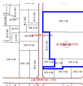
[부천시 원종동 사업지구 경계]

이와 더불어, 본 사업에서 가장 주목해야 할 부분은 LH가 참여하여 조합과 공동으로 시행하는 방식으로 추진되었다는 점이며, 이 덕분에 사업추진이 다소 더뎠던 부천 원종지구가 '17년 LH가 참여한 이후 조합설립(18년 3월)부터 준공까지 4년 7개월이 소요되어 기존 대규모 정비사업 대비 사업기간을 크게 단축할 수 있게 되었다.