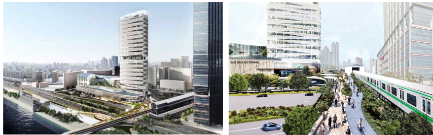
[동서울터미널 개발 제안(안)]

또한, 서울특별시는 현재 버스터미널 단일 용도로만 활용되고 있는 해당 도시계획시설 부지를 다양한 용도로 활용 가능하도록 도시관리계획 변경을 논의할 예정이다.