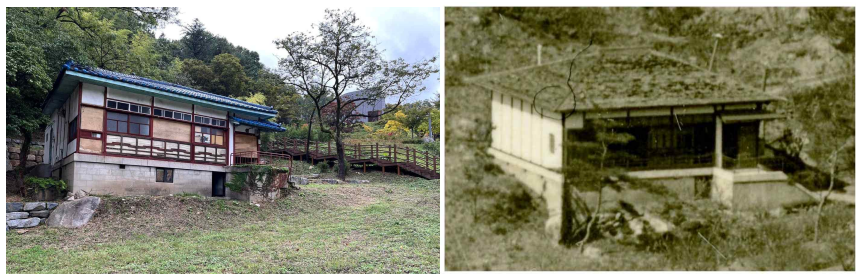
[대전 보문산 근대식 별장 (좌: 현재모습, 우:1930년대)]

보문산 근대식 별장은 30일간의 등록 예고 기간 동안, 추가조사와 함께 시민들의 다양한 의견을 수렴하여, 문화재위원회 심의를 거쳐 연내 등록 여부가 확정될 예정이다.